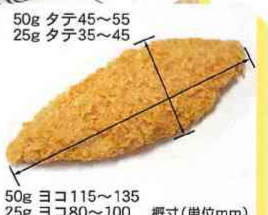
50g ヨコ115~135 25g ヨコ80~100 概寸(単位:mm)

南半球で漁獲し急速凍結されたほきをフライにしました。肉質は淡白で魚臭がありません。