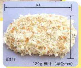
150g 153 × 88 × 25 概寸 (単位:mm)